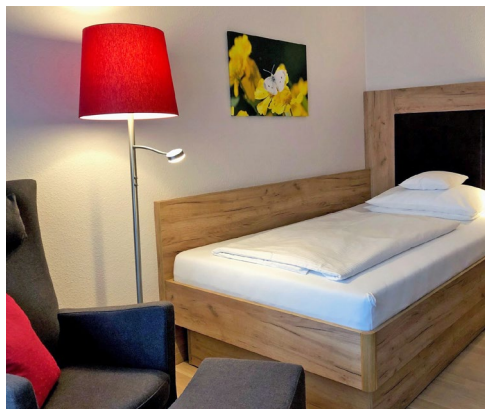
15 m 2 Standard EZ ohne Balkon