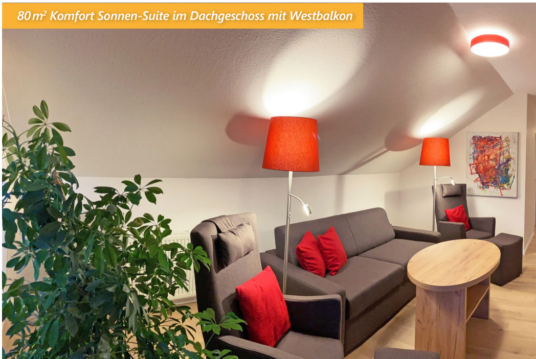
80 m 2 Komfort Sonnen-Suite im Dachgeschoss mit Westbalkon