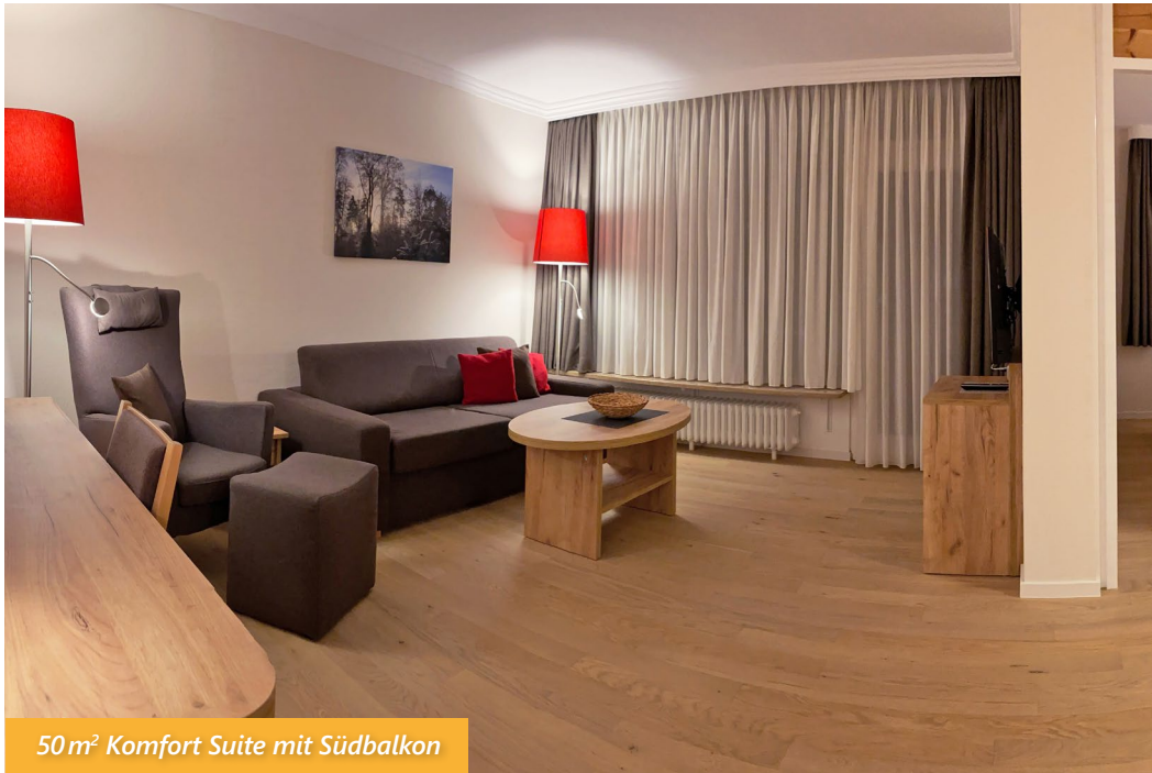
50 m 2 Komfort Suite mit Südbalkon