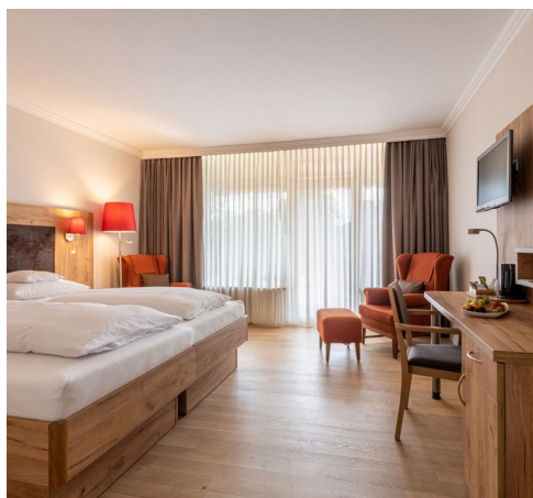
40 m 2 Komfort Doppelzimmer mit Südbalkon