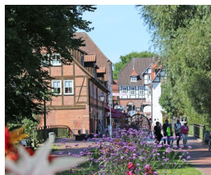
Innenstadt Bad Bevensen

Medingen und Ebstorf, die Naturlandschaft Klein Bünstorfer Heide, der Elbe-Seiten-Kanal, ausgewiesene Rad- und Nordic Walking-Wanderwege, der Wald-Trim-Dich-Pfad an der Ilmenau und unsere Mischwälder vereinen alle Annehmlichkeiten, die Sie für einen erholsamen,